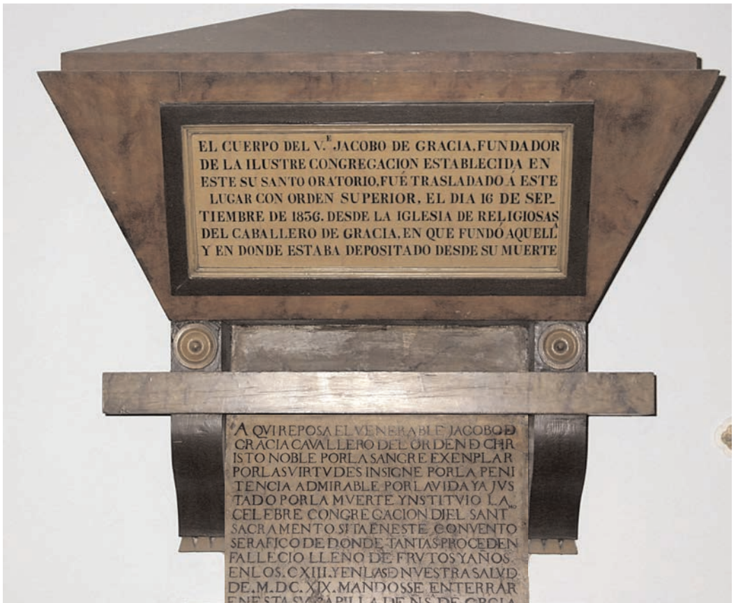
El sepulcro actual y debajo la lápida primitiva.