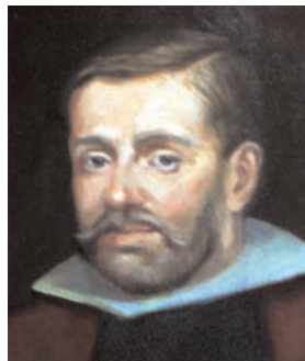
El Venerable Caballero de Gracia

Agradeceremos que los que consigan favores a través de la intercesión del Venerable Caballero de Gracia lo comuniquen en el Rectorado del Oratorio.