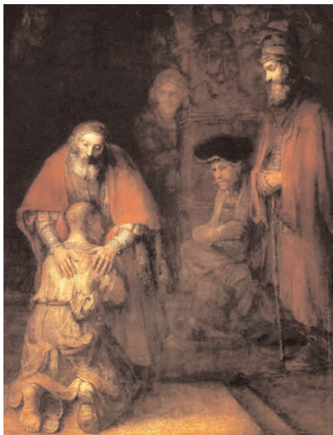
El regreso del hijo pródigo, por Rembrandt.

[En la parábola del hijo pródigo] ¡Cuán bonita es la ternura del padre! La misericordia del padre es desbordante, incondicional, y se manifiesta incluso antes de que el hijo hable. Ciertamente, el hijo sabe que se ha equivocado y lo reconoce: «He pecado... trátame como a uno de tus jornaleros» (v. 19). Pero estas palabras se disuelven ante el perdón del padre.