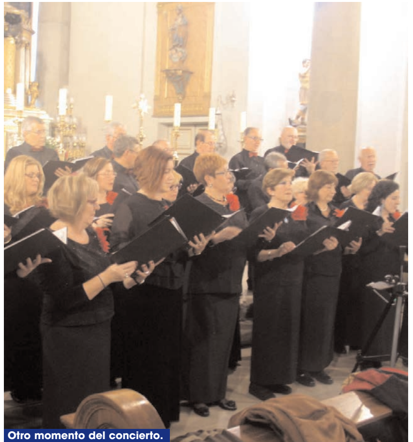
Otro momento del concierto.