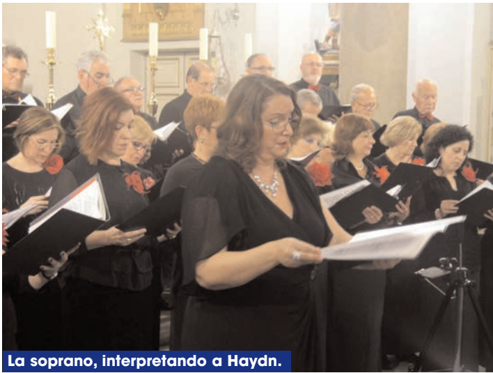
La soprano, interpretando a Haydn.