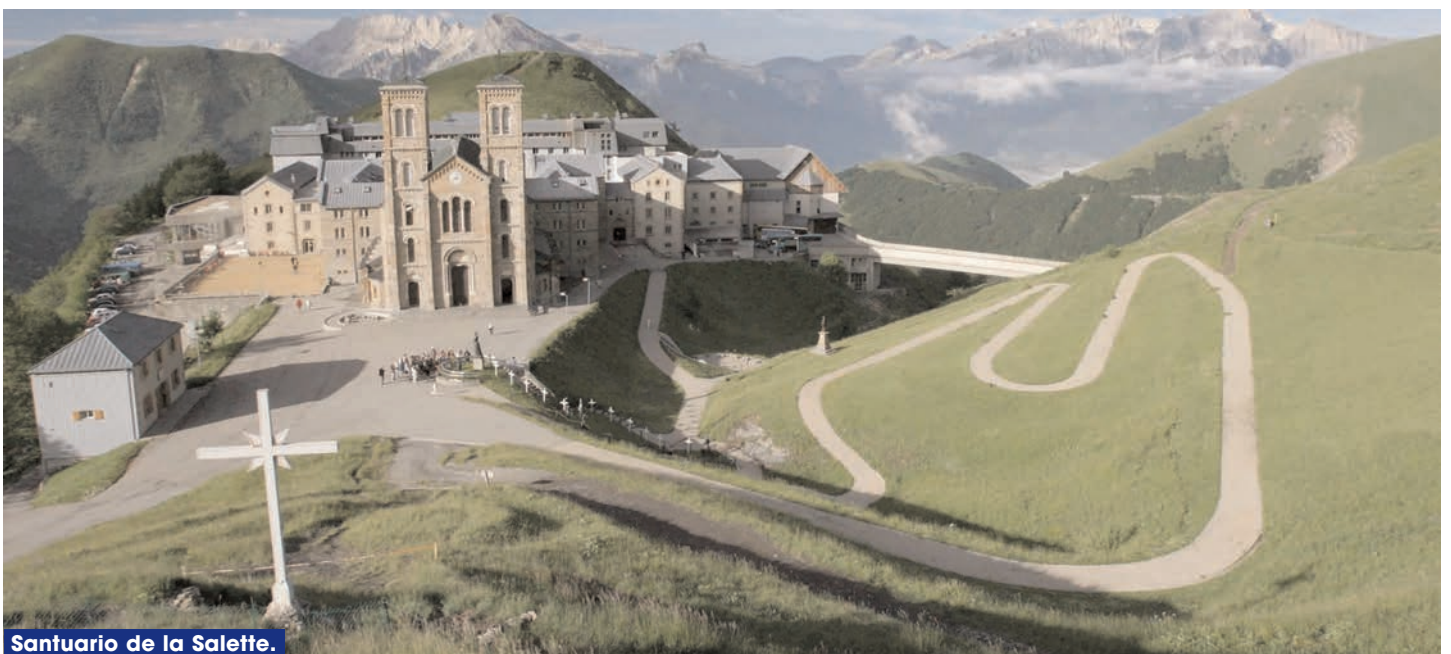
Santuario de la Salette.