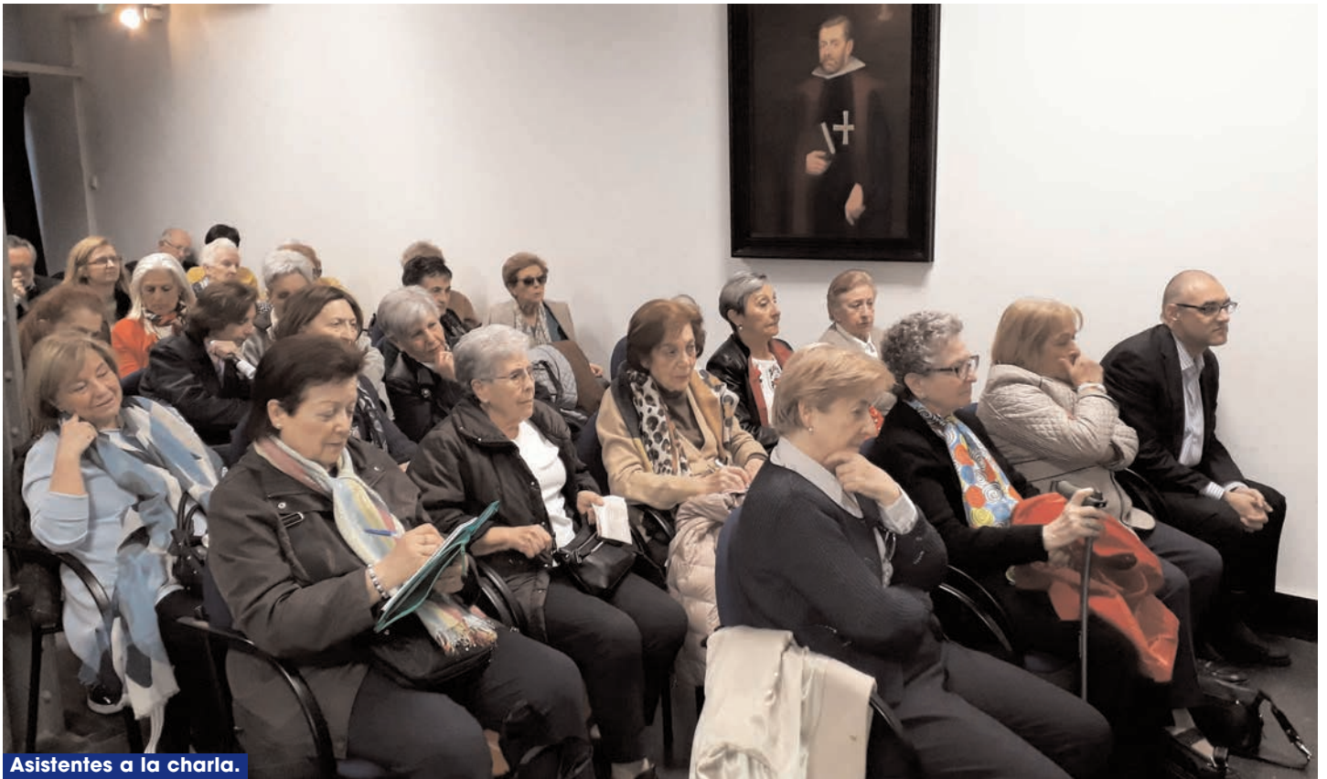
Asistentes a la charla.

cuadro de la Virgen de la Saleta que había entonces en nuestro Oratorio.