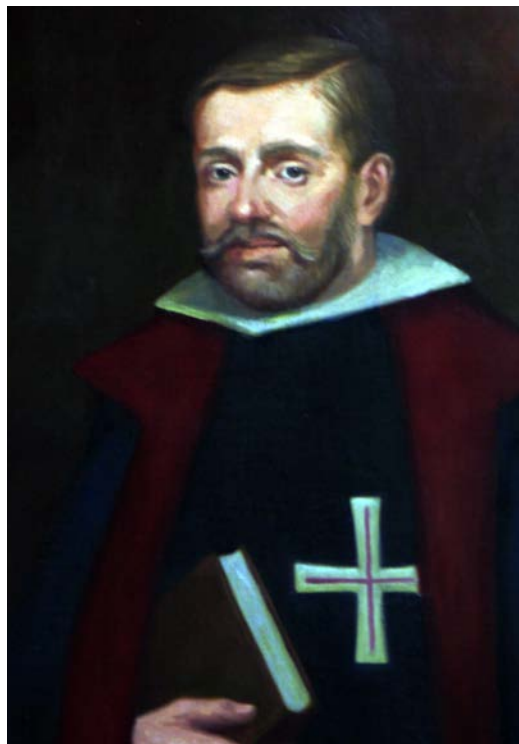
Retrato del Caballero de Gracia por Víctor López Jurado