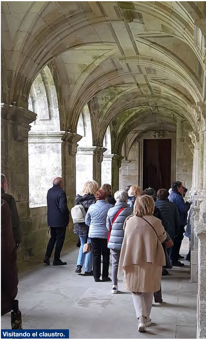
Visitando el claustro.