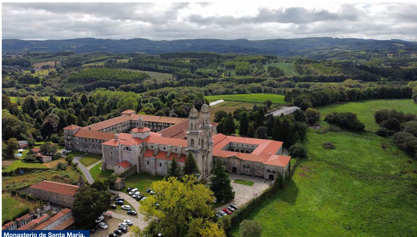
Monasterio de Santa María.

Al terminar la Misa en Mondoñedo salimos para Sobrado, a 90 km más al sur. El paisaje, todo verde y por carreteras comarcales, es muy bonito.