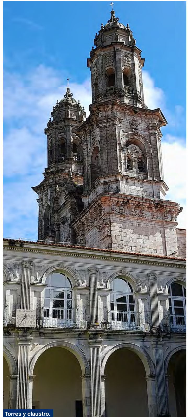
Torres y claustro.

Así comenzó la vida monástica cisterciense en Santa María de Sobrado. Durante los siglos XII y XIII, el monasterio experimentó una gran actividad espiritual y económica. A lo largo de su historia, pasó por etapas de decadencia, pero en 1498, se incorporó a la congregación de San Bernardo de Castilla de la orden del Císter.