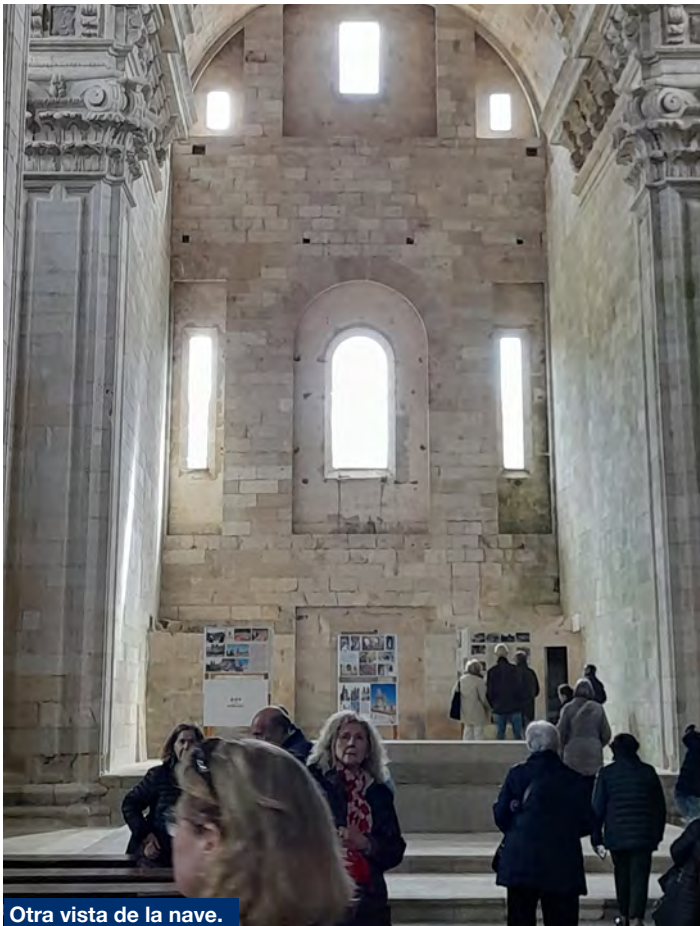
Otra vista de la nave.