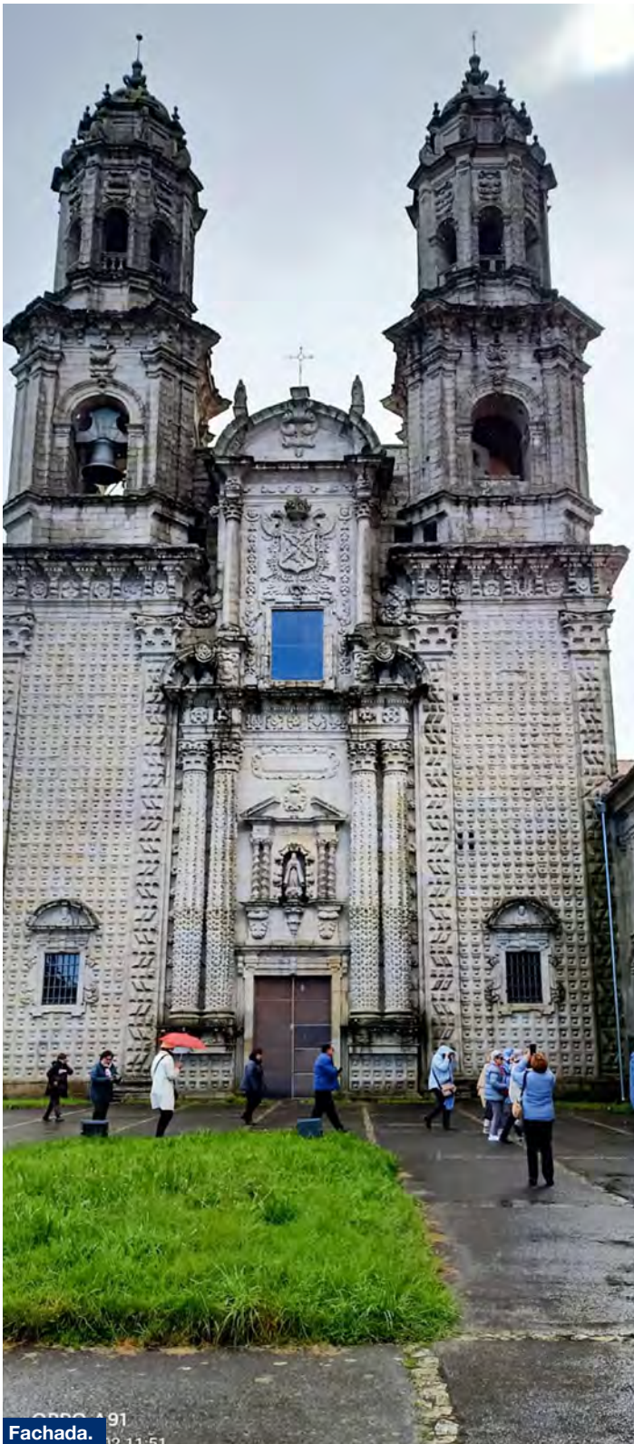
Fachada. 91 12-11-51

en Francia, de donde era abad, una comunidad de monjes.