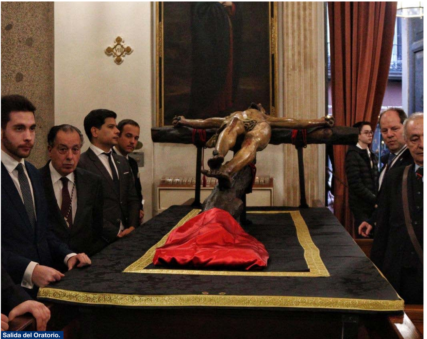
Salida del Oratorio.