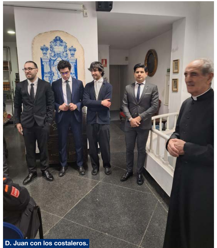
D. Juan con los costaleros.