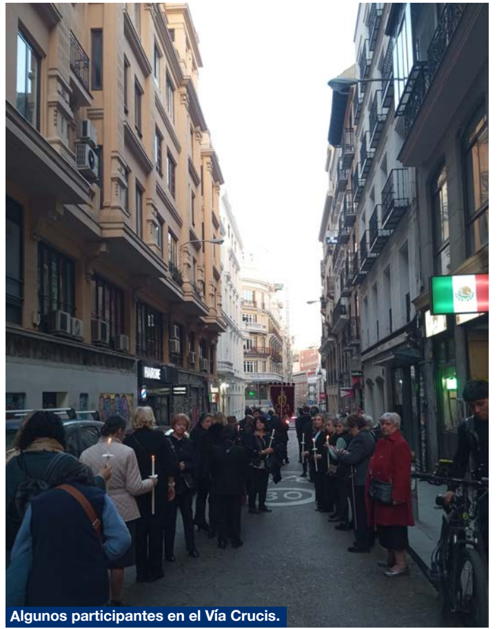
Algunos participantes en el Vía Crucis.