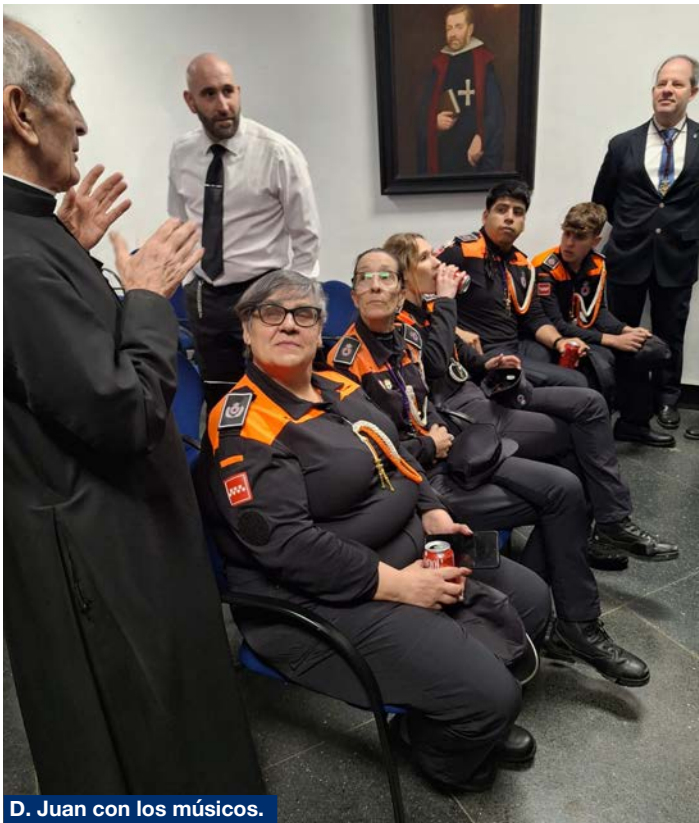
D. Juan con los músicos.