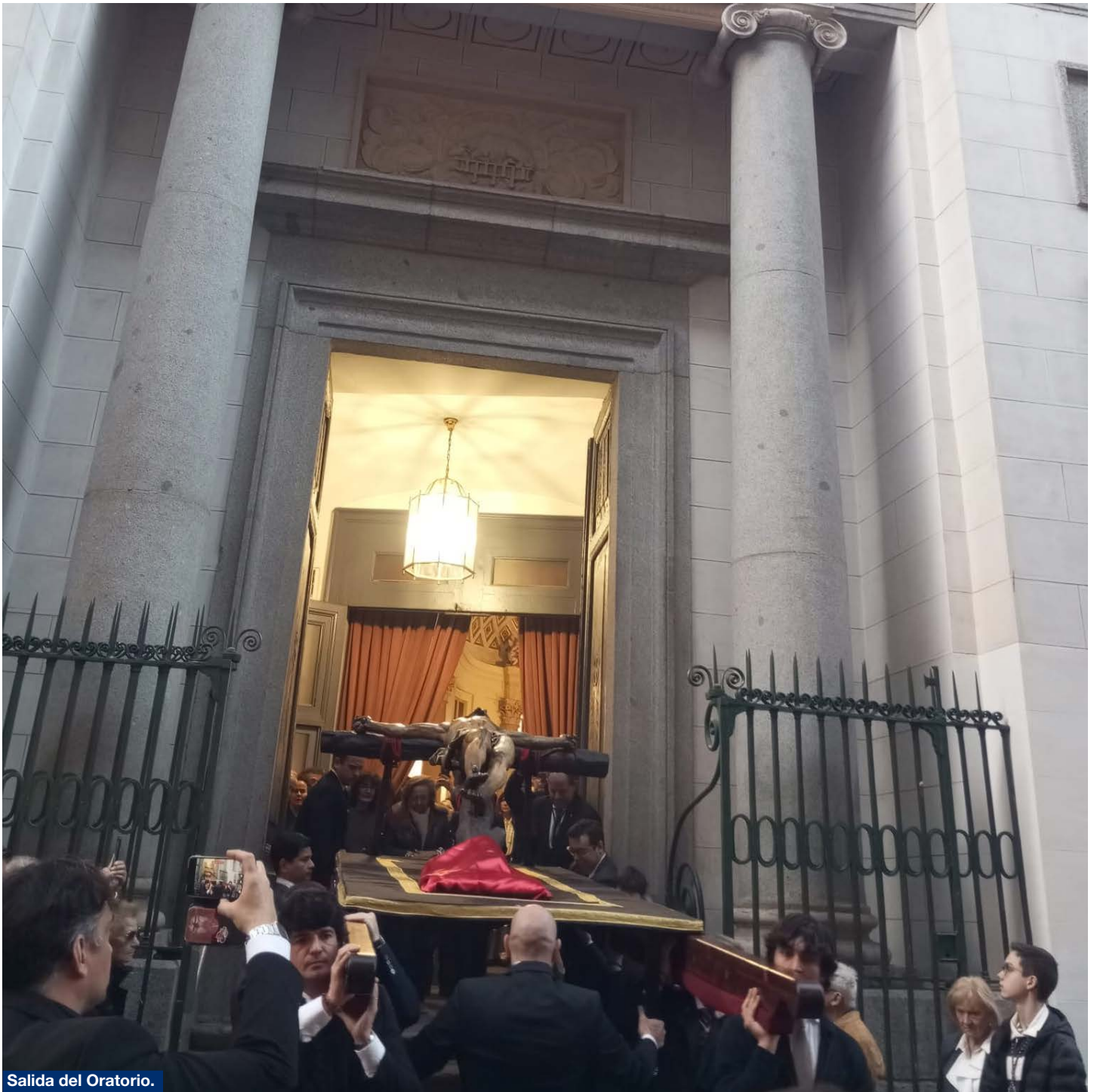
Salida del Oratorio.