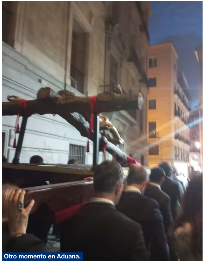
Otro momento en Aduana.