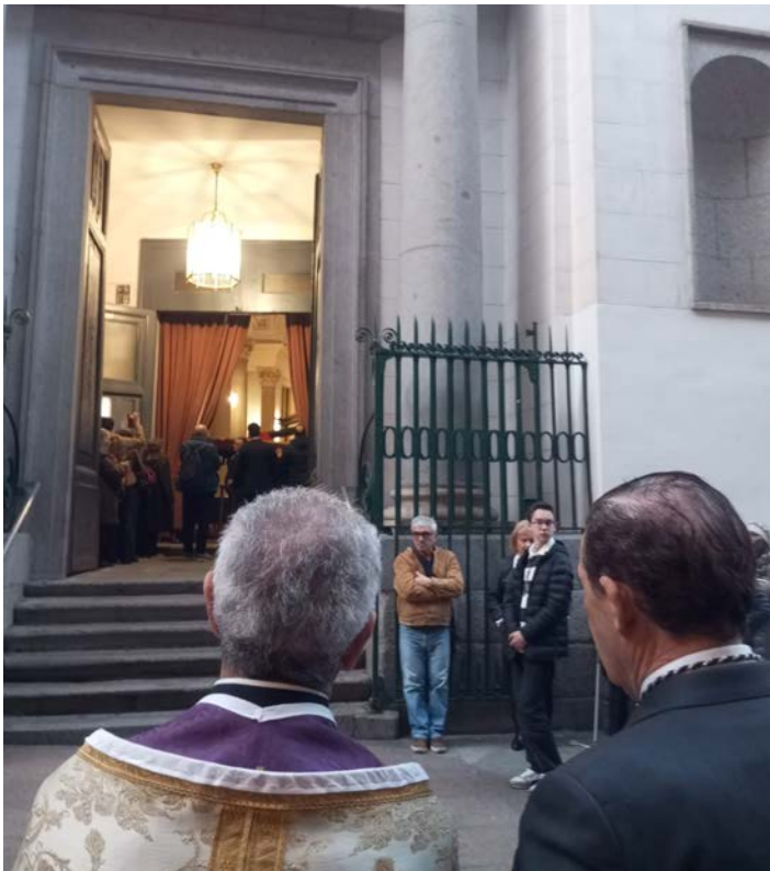
El Rector y el Presidente de la Asociación esperando la salida.