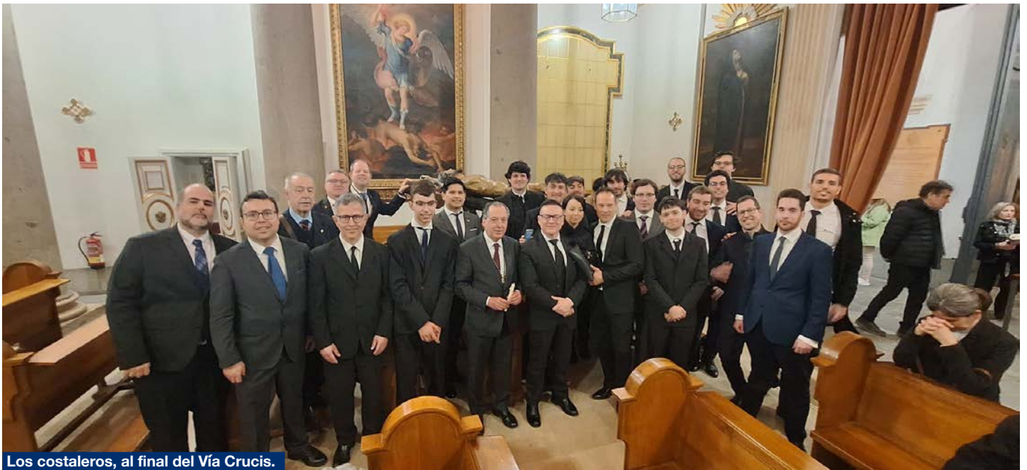
Los costaleros, al final del Vía Crucis.