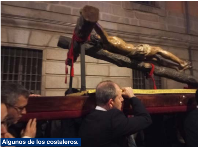
Algunos de los costaleros.