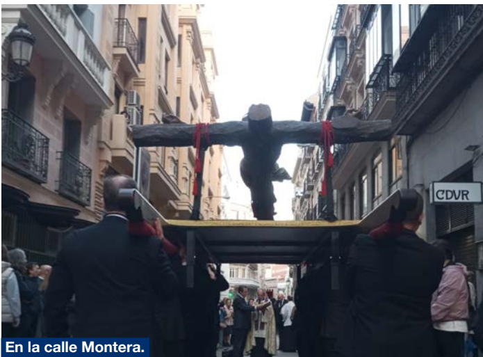
En la calle Montera.