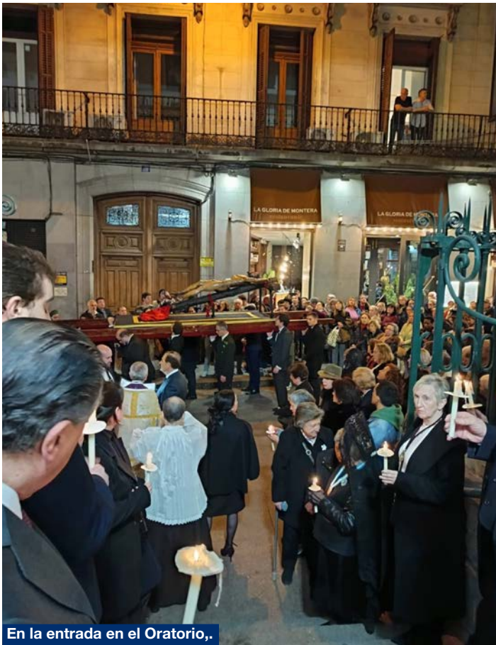
En la entrada en el Oratorio.