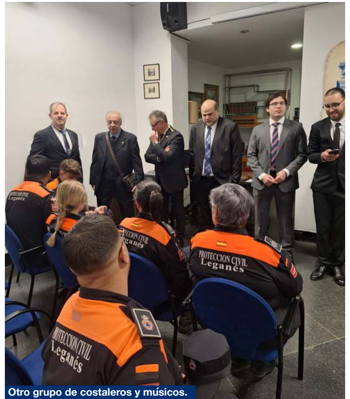
Otro grupo de costaleros y músicos.