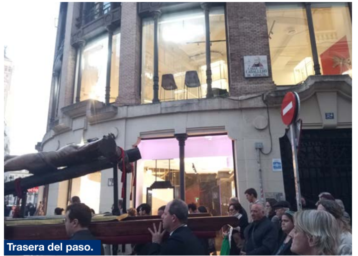
Trasera del paso.