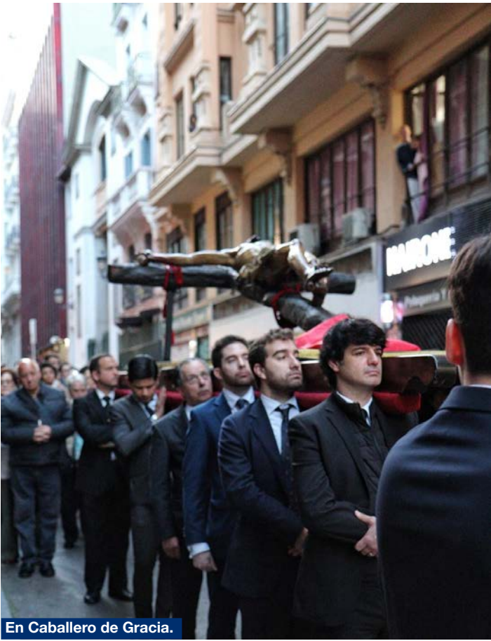
En Caballero de Gracia.