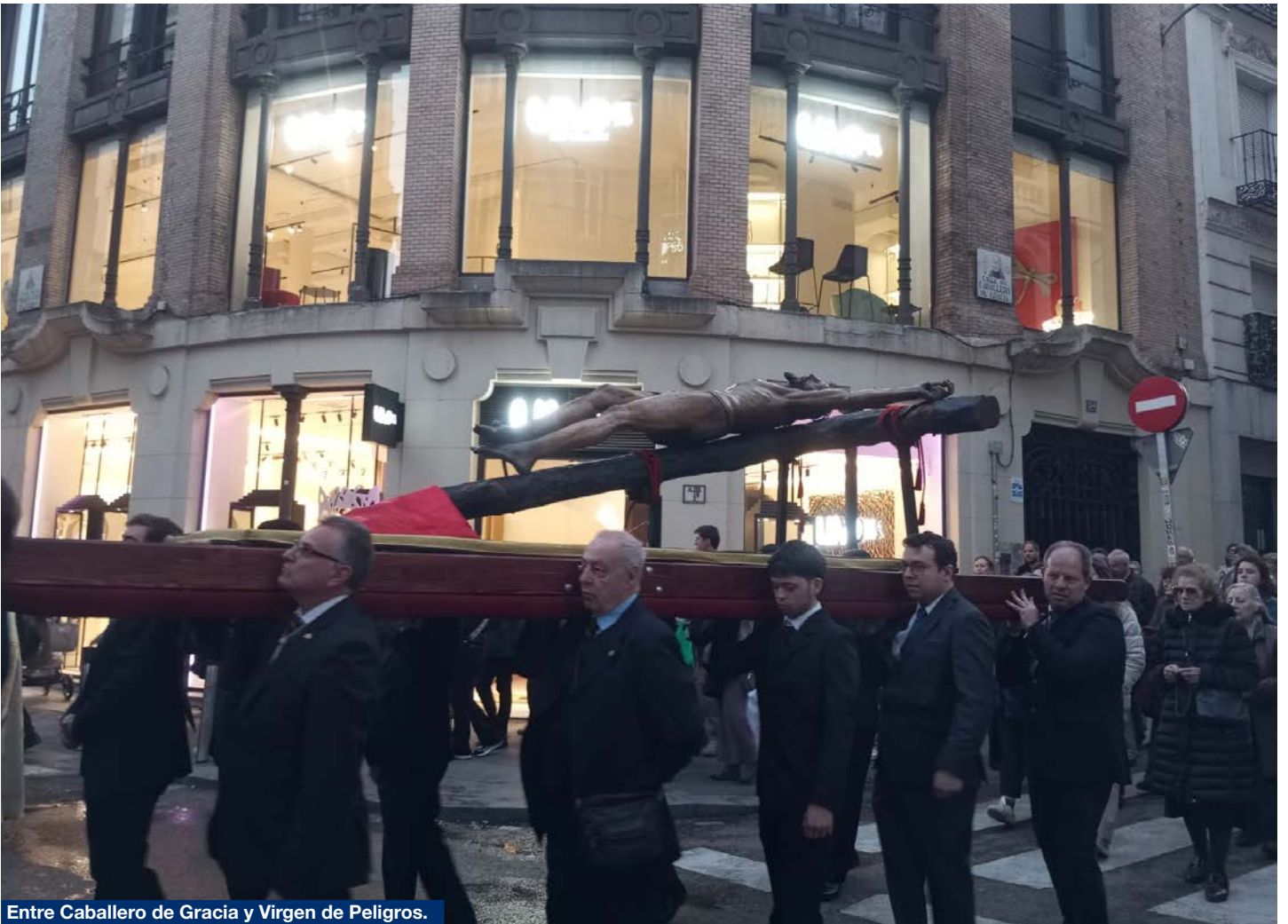
Entre Caballero de Gracia y Virgen de Peligros.