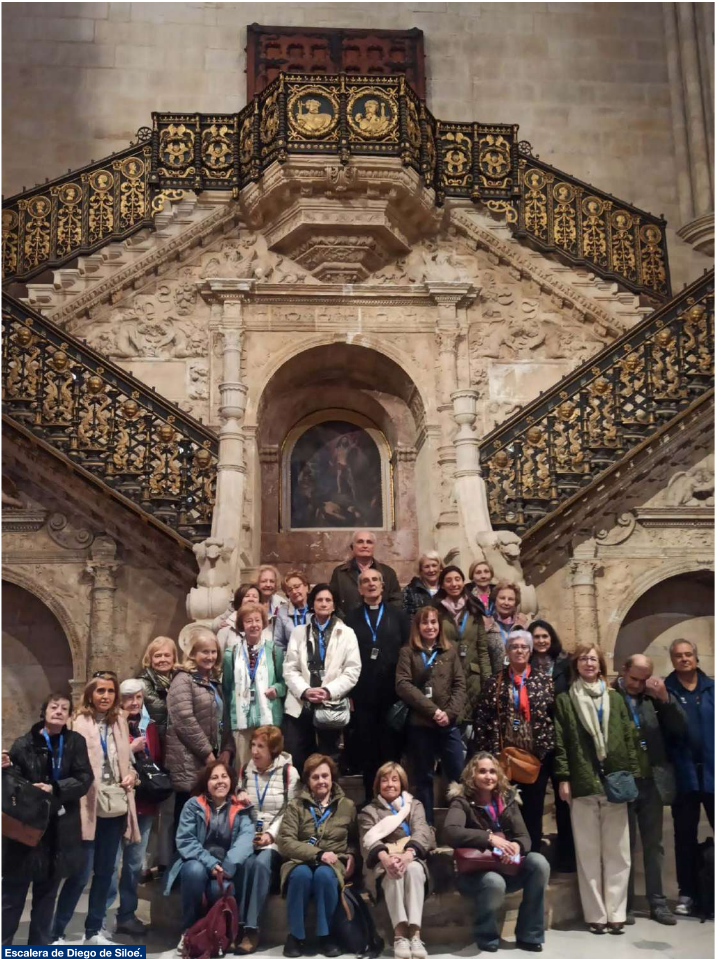
Escalera de Diego de Siloé.