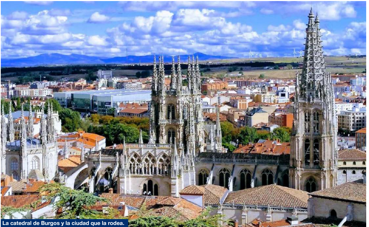
La catedral de Burgos y la ciudad que la rodea.