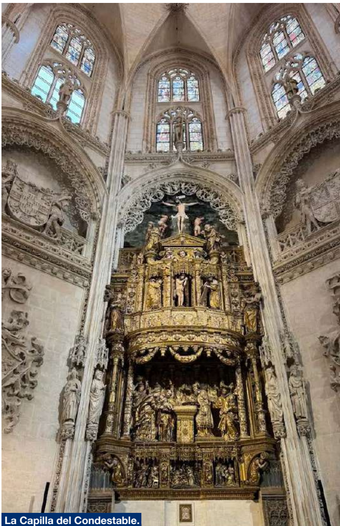
La Capilla del Condestable.

La Catedral de Burgos. Su nombre oficial es Santa Iglesia Catedral Basílica Metropolitana de Santa María de Burgos. Su construcción comenzó en 1222, siguiendo patrones góticos franceses. Tuvo importantísimas modificaciones en los siglos XV y XVI: las agujas de la fachada principal, la Capilla del Condestable y el cimborrio del crucero, elementos del gótico avanzado que dotan al templo de su perfil inconfundible. Las últimas obras de importancia (la Sacristía o la Capilla de Santa Tecla) pertenecen ya al siglo XVIII, siglo en el que también se modificaron las portadas góticas de la fachada principal. El estilo de la catedral es el gótico, aunque posee, en su interior, varios elementos decorativos renacentistas y barrocos. La construcción y las remodelaciones se realizaron con piedra caliza extraída de las canteras de la cercana localidad burgalesa de Hontoria de la Cantera.