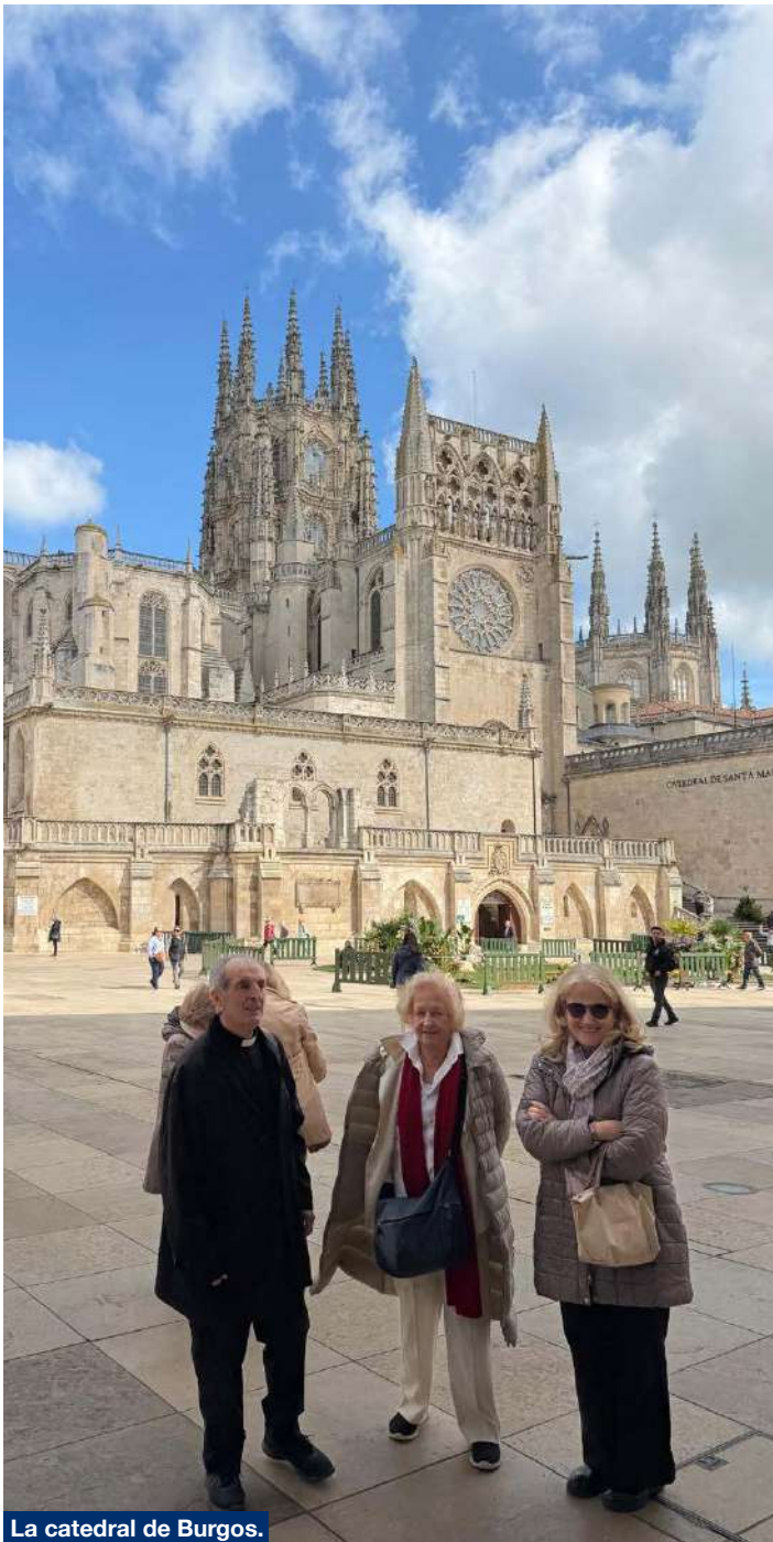
La catedral de Burgos.

Esteban, que tiene un gran retablo. Celebramos la Santa Misa en la Capilla de Santa Tecla, donde está la famosa imagen del Santo Cristo de Burgos. Recogemos aquí algunos datos de la Catedral.