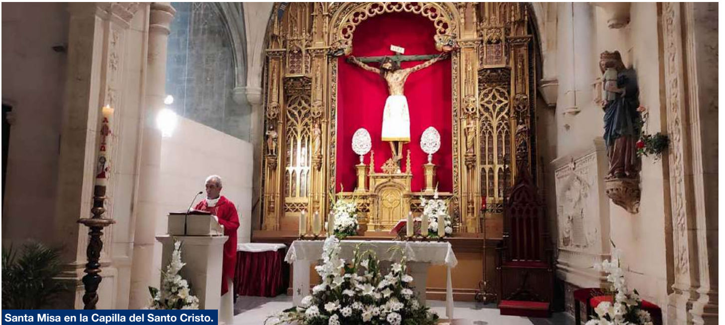
Santa Misa en la Capilla del Santo Cristo.