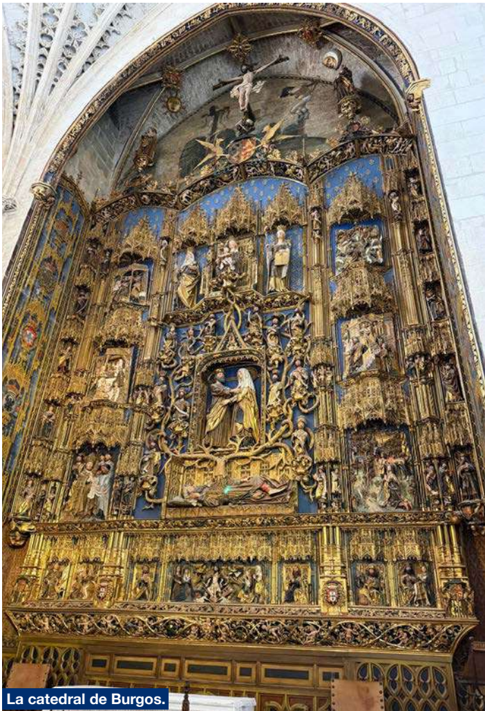
La catedral de Burgos.