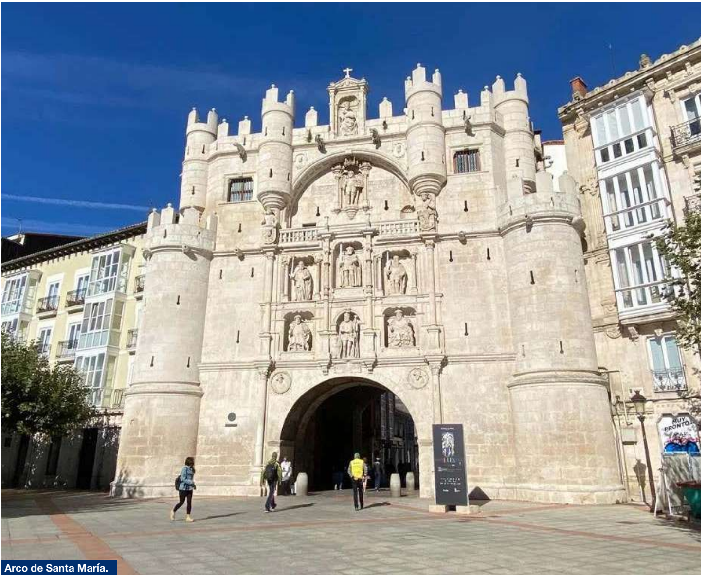
Arco de Santa María.

lino, en la que trabajaron la familia Colonia, Diego de Siloé y Felipe Bigarny; el retablo gótico hispano-flamenco de Gil de Siloé para la Capilla de Santa Ana; y la renacentista Escalera Dorada, de Diego de Siloé.