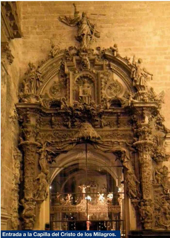
Entrada a la Capilla del Cristo de los Milagros.