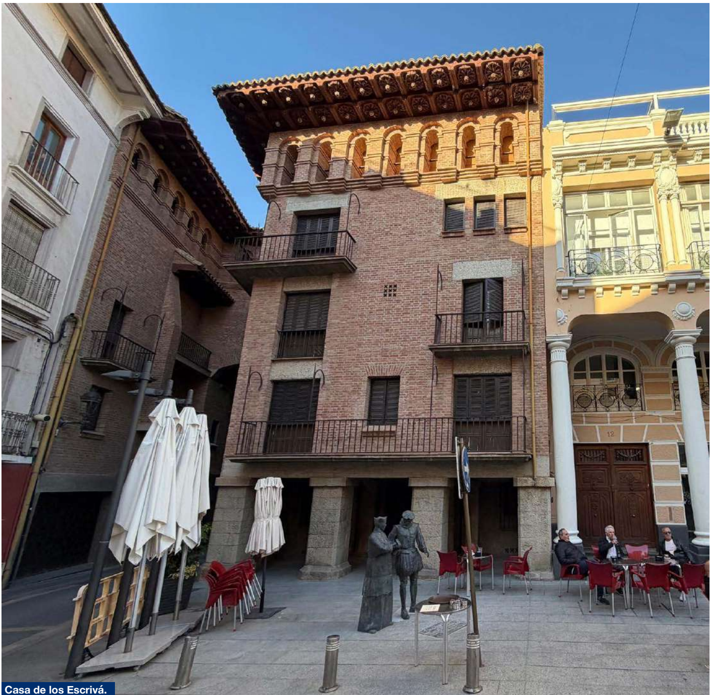
Casa de los Escrivá.

La Capilla: Es considerada el espacio más artístico de la catedral. Se construyó a principios del siglo XVIII (1707) en un estilo profundamente barroco.