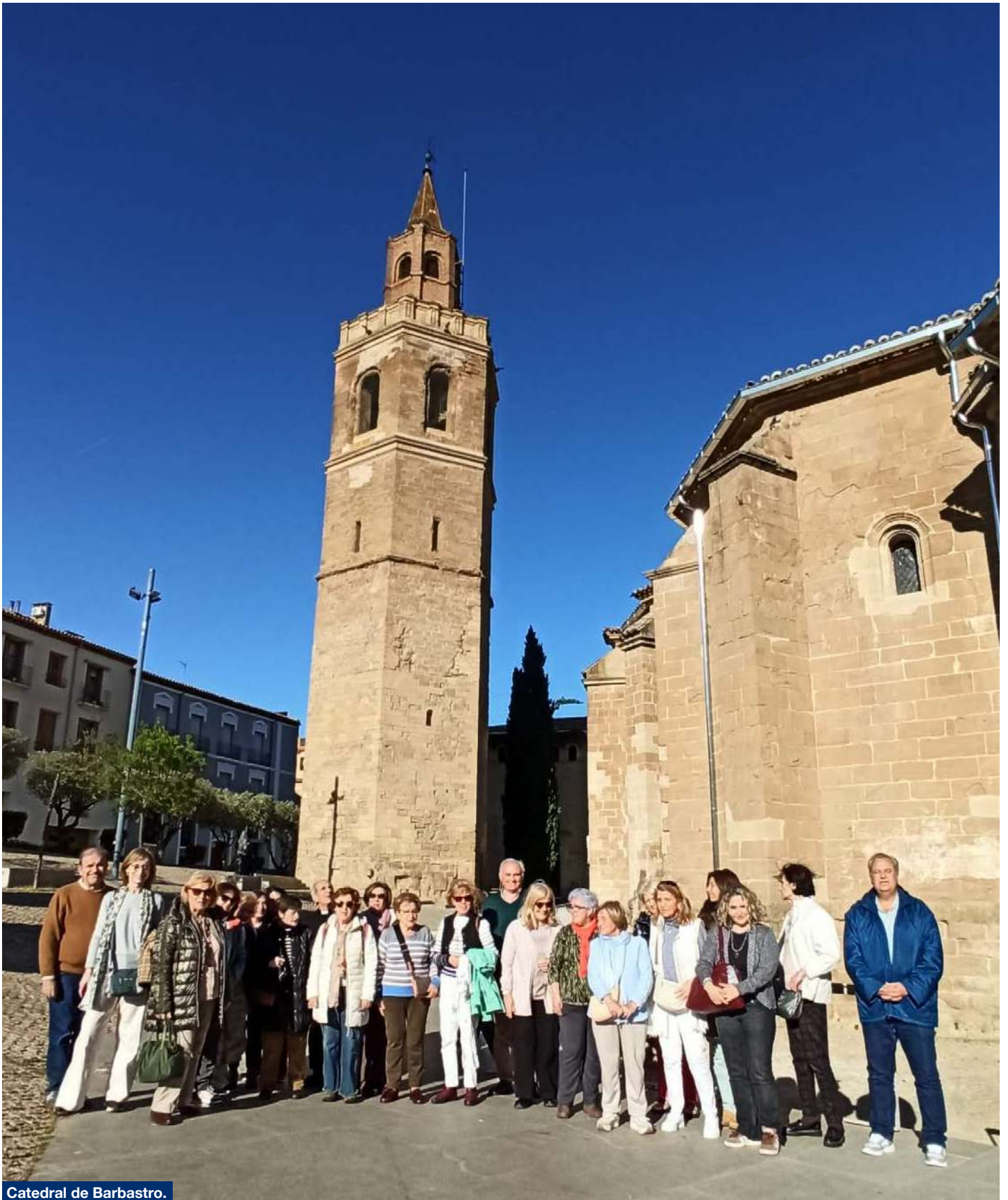
Catedral de Barbastro.

y concluida a su muerte por su discípulo Juan de Liceyre. Es una catedral de gran belleza que vale la pena ver. Se puede hacer un recorrido virtual a través de la web https://www.aragonvirtual.es/catedral_barbastro/