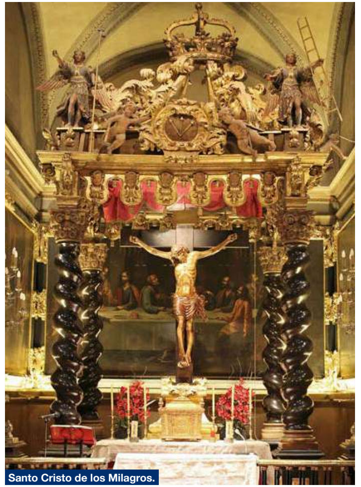
Santo Cristo de los Milagros.