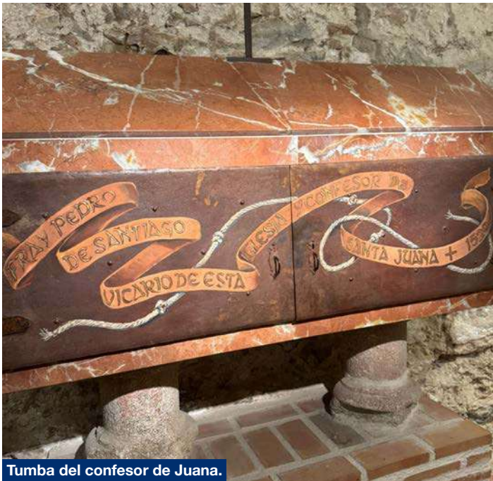
Tumba del confesor de Juana.