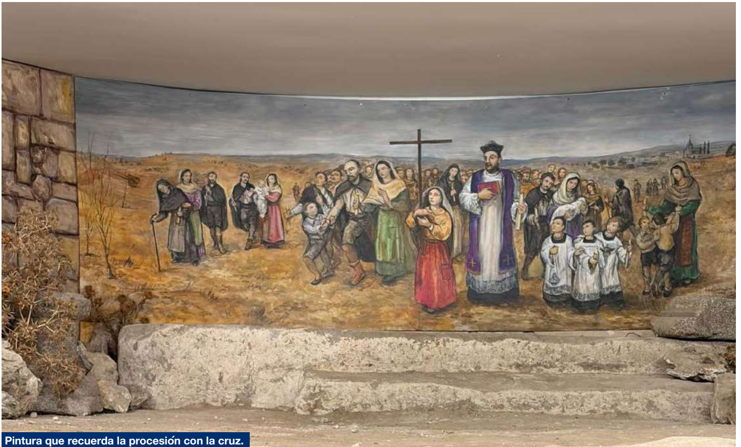
Pintura que recuerda la procesión con la cruz.